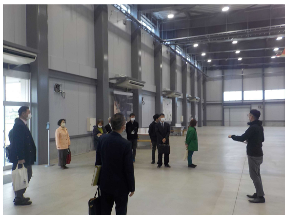
【武生中央公園屋内催事場】