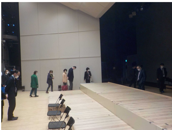
【越前市文化センター】