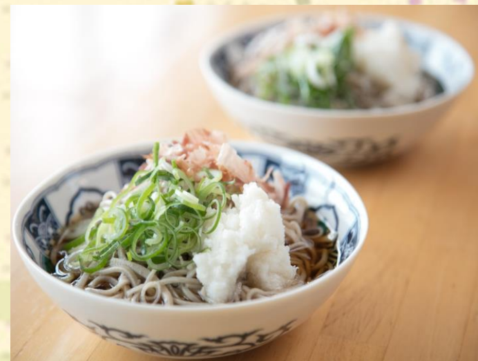
自分で作ったおろしそば（イメージ）