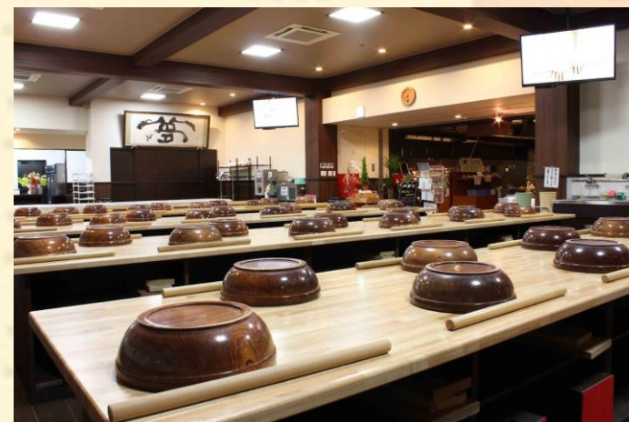
体験の会場（イメージ）

※追加メニュー（天ぷら・焼き鯖寿司など）を加えて、定食形式での利用も可能。 ※行程のご都合などで、やむを得ず上記時間帯が難しい場合はお気軽にご相談ください。