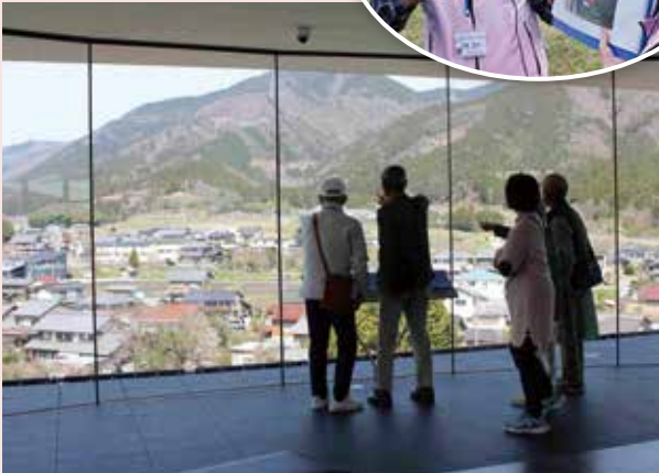
岐阜関ヶ原古戦場記念館