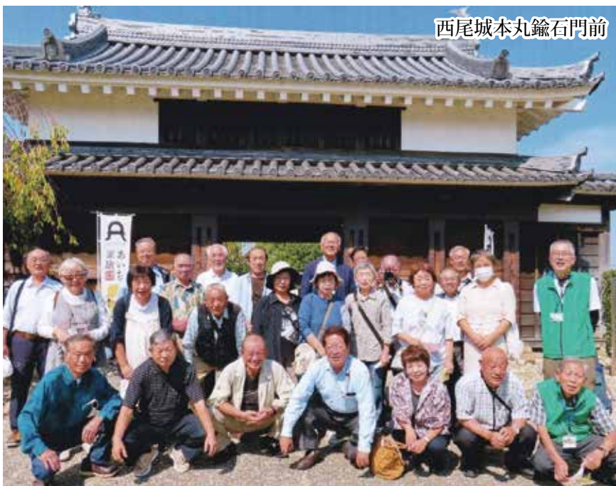
西尾城本丸鑰石門前

にはとても想い歴史、わが町の恩沢池の歴史と同じと感動しました。久しぶりの旅行でしたが、次回訪問するときは、みそ煮込みうどんを食べる、うなぎにする食欲旺盛な会話が弾み楽しい旅行にしたいものです。