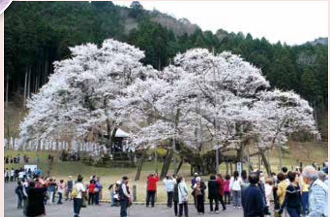
根尾谷薄墨ザクラ