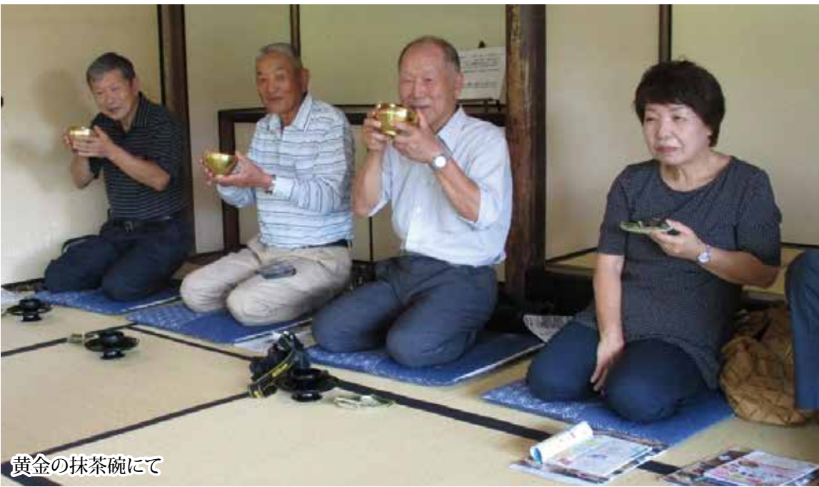
黄金の抹茶碗にて

9月27日、よく晴れた朝いきいきクラブの会員22名は、愛知県西尾市に向かつて出発した。今回の日帰り旅行の目的は、恩沢池の池で関わりのある西尾市と友好を結ぶことにありました。恩沢池の由来、三河西尾藩との関わりについてバスの中で勉強会。歴史に詳しい歴史保存会の方に講師をお願いし、改めて勉強させて頂きました。