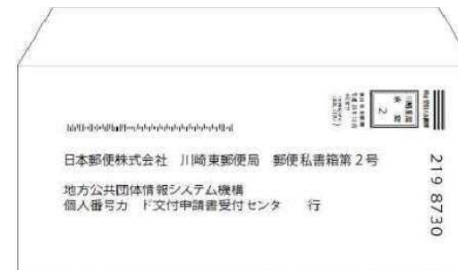
④個人番号カード申請書の返信封筒(定形サイズ) ※1通につき1部同封