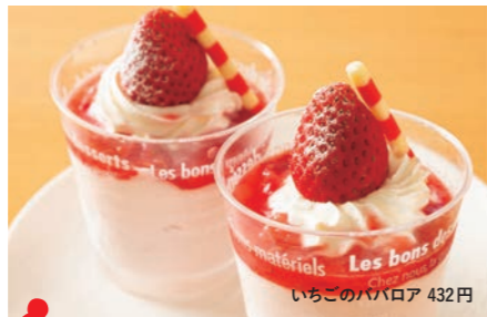
2 洋菓子 JUN いちごのババロア 432円

越前市姫川2-3-39 ☎0778-22-1471 ◎10:00～19:00(カフェ～18:00) ◎水曜日、月1回日曜日 ◎20席 ◎10台