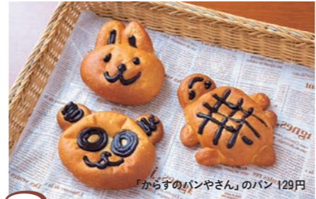
6 ロハスカフェ 「からすのパンやさん」のパン 129円

越前市村岡2-5-39 ☎0778-78-9161 ◎7:00～19:00(日祝のみ～18:00) ◎火、水曜日 ◎なし ◎14台