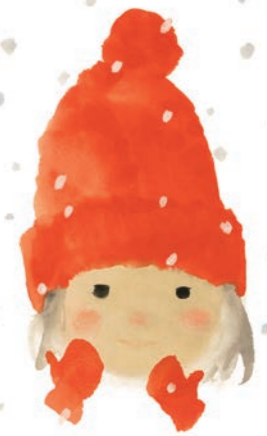
いわさきちひろ 1972年「ゆきのひのたんじょうび」(至光社)