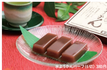
7 越前そばの里 水ようかんハーブ(6切) 380円

厳選した北海道小豆を使った、お土産人気No.1の水ようかん。すべて手づくりで手間暇かけて作られた味わいは、あっさり系の優しい甘さでスツクリと食べられます。