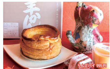
8 栄雲堂 りんごパイ 995円

越前市真柄町7-37 ☎0778-21-0272 ◎9:30～16:00 ※変更になる場合有 ◎1/1～1/3、6/28～6/30 ◎70席 ◎150台