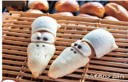
5 パン メゾン Depa からすのパン 259円

越前市吾妻町3-29 ☎0778-24-4711 ◎9:00～19:00 ◎日、月曜日 ◎なし ◎なし