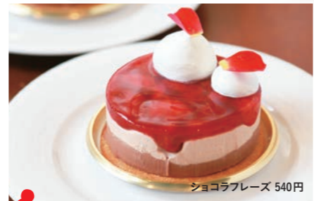
3 エスポワール ショコラブーゼ 540円

越前市平出2-16-1 ☎0778-23-0926 ◎10:00～19:00(カフェ17:00L.O.) ◎水曜日 ◎20席 ◎40台