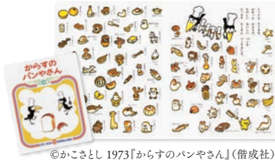
◎かこさとし1973『からすのパンやさん』(借成社)

かこさとしの人気絵本『からすのパンやさん』(1973年借成社)は、からすのまち、いずみもりのからすのパンやさんのお話です。4羽の子どもたちの意見を参考に、おとうさんとおかあさんは、すてきな形のパンをどっさり焼きました…。今回は、越前市内のパン屋さんが絵本に登場するような楽しい形のパンを再現しました。