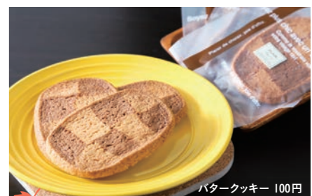
11 菓匠 木津屋 バタークッキー 100円

越前市元町2-35 ☎0778-22-0837 ◎9:00～18:30(日のみ～18:00) ◎月曜日 ◎なし ◎5台