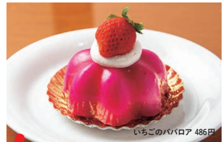
1 シュトラウス金進堂 いちごのババロア 486円

「赤い毛糸帽」をイメージしたババロアの中には果肉を感じるイチゴのゼリーと練乳クリーム、土台にはスポンジ生地。キュートで美味しい、笑顔になれるスイーツです。