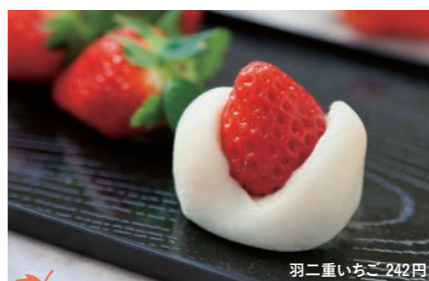
10 御菓子司 野木 羽二重いちご 242円

越前市高瀬2-3はぐもぐ内 ☎070-2396-1628 ◎12:00～15:00(土日のみ11:00～16:00) ◎月曜日 ◎60席 ◎共有駐車場