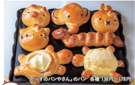
4 マルシャン 「からすのパンやさん」のパン 各種 138円～178円

かこさとしの人気絵本『からすのパンやさん』(1973年借成社)は、からすのまち、いずみもりのからすのパンやさんのお話です。4羽の子どもたちの意見を参考に、おとうさんとおかあさんは、すてきな形のパンをどっさり焼きました…。今回は、越前市内のパン屋さんが絵本に登場するような楽しい形のパンを再現しました。