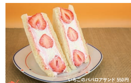
9 明城ファーム 武生中央公園店 いちごのババロアサンド 550円

越前市京町1-1-2 ☎0778-22-0326 ◎9:00～18:00 ◎月曜日 ◎12席 ◎なし