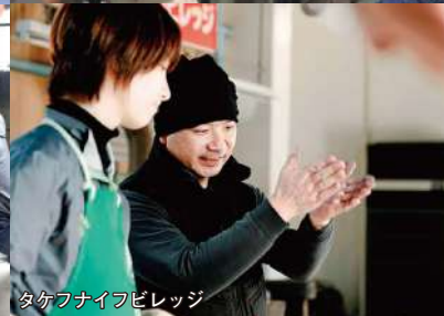
タケフナイフビレッジ