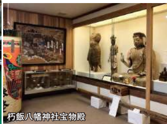
朽飯八幡神社宝物殿