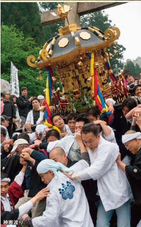
紙祖神 岡太神社・大瀧神社

●新型コロナウイルス感染症拡大の影響により、神輿を巡行するまつりの開催可否は4月中旬に決定します。神事のみ開催になる場合は、当ツアーは催行決定後でも中止とさせていただきます。あらかじめご了承ください。