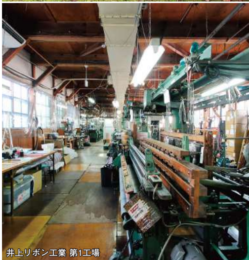
井上リボン工業 第1工場