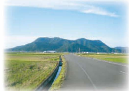
味真野から三里山方面への眺望