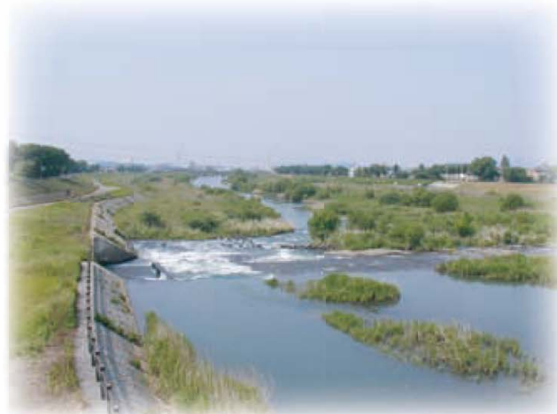
緑豊かな日野川の河川環境