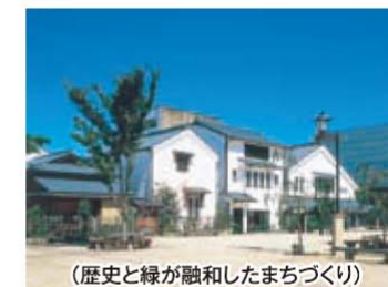
(歴史と緑が融和したまちづくり)