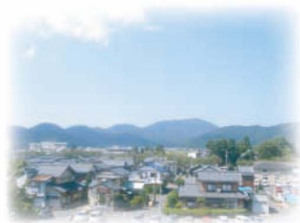
新町から鬼ヶ岳方面への眺望