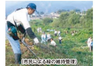
(市民による緑の維持管理)