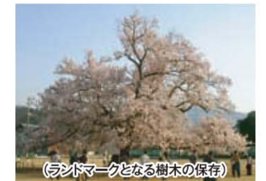
(ランドマークとなる樹木の保存)