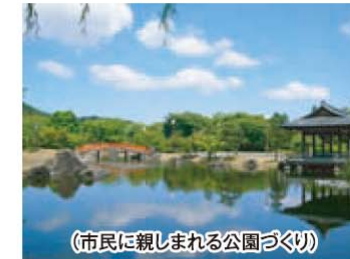
(市民に親しまれる公園づくり)