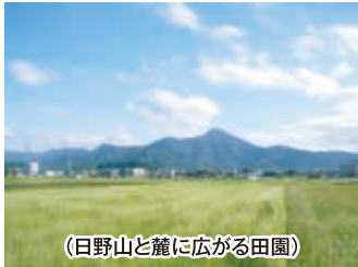
(日野山と麓に広がる田園)