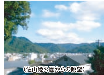
(佐山姫公園からの眺望)