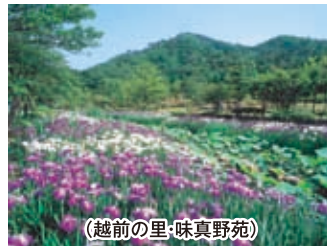
(越前の里・味真野苑)