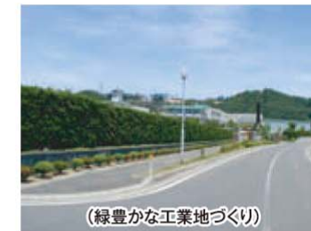
(緑豊かな工業地づくり)