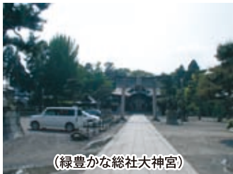
(緑豊かな総社大神宮)