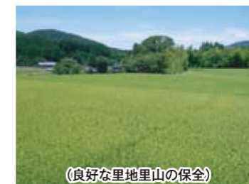
(良好な里地里山の保全)