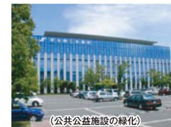
(公共公益施設の緑化)