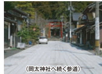
(岡太神社へ続く参道)