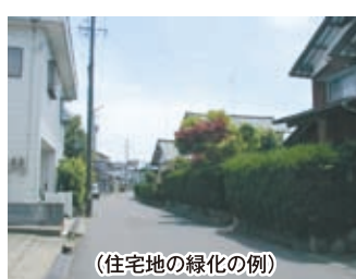
(住宅地の緑化の例)