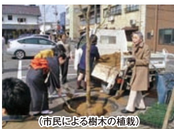
(市民による樹木の植栽)