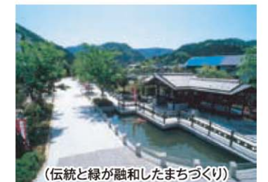
(伝統と緑が融和したまちづくり)