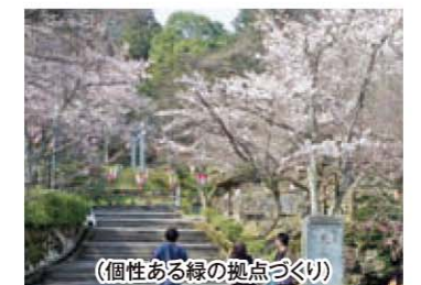
(個性ある緑の拠点づくり)