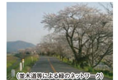
(並木道等による緑のネットワーク)