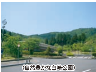
(自然豊かな白崎公園)