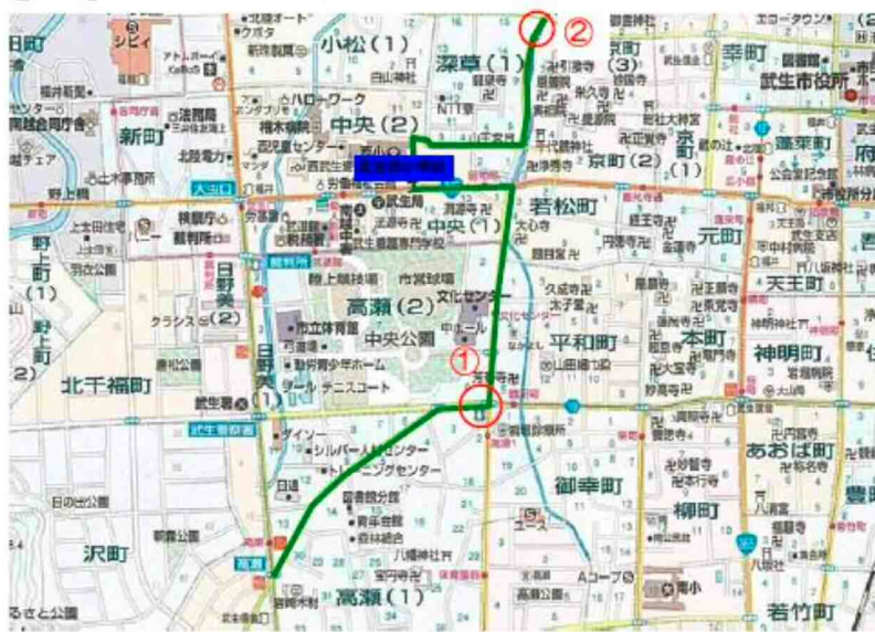
通学路の緊急合同点検マップ