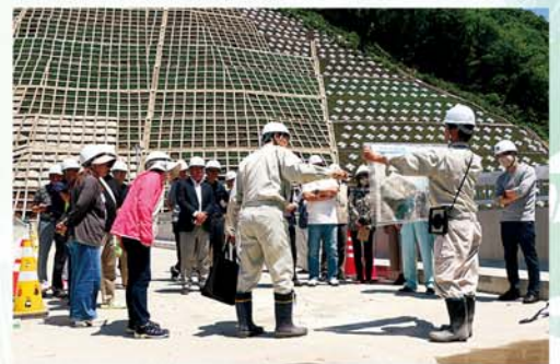
5/17(日)、自治振興会役員、理事で見学会を行いました。