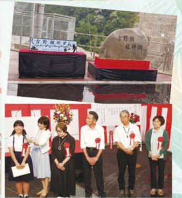
ダム湖名称「吉野瀬龍神湖」命名者として、5名の方に感謝状が贈られました

6月7日(日)、福井県知事をはじめ地元関係者、施工業者等約200人が臨席して吉野瀬川ダムの竣工式が挙行されました。昭和61年度に事業採択がなされてから、実に40年の歳月を費やし、ついに完成を迎えました。