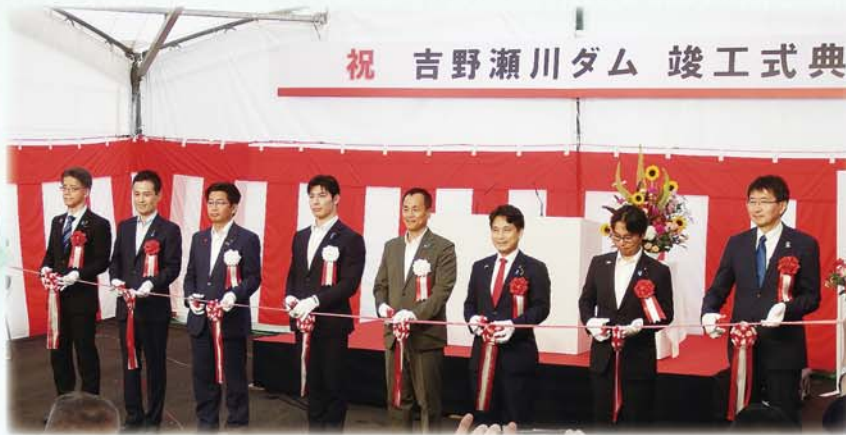
祝 吉野瀬川ダム 竣工式典