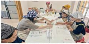
様々な調味料を実際に味わい原材料の違いを確かめました