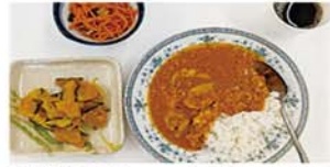
スパイスカレー、キャロットラペ、かぼちゃと玉ねぎのとろとろ煮