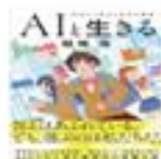
『AIと生きる』 結城 浩/著