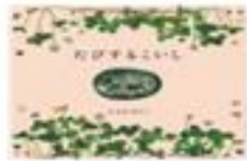
『たびするこいし』 たかお ゆうこ/作