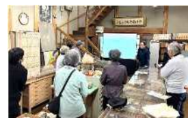
▲先日の見学会の様子

水晶の研究で有名な世界的鉱物学者市川新松先生(1868～1941)が建てられた。大正4年(1915)に設計着工して、3年後に竣工した文化的価値のある建造物である。