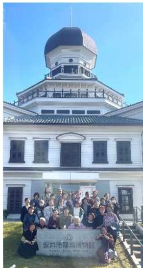
坂井市龍翔博物館にて