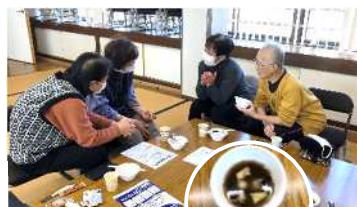
ほっこり 白玉ぜんざい