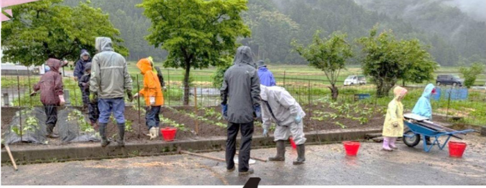
服間元気クラブ(畑部)と児童

5/21(木) 小雨の中、小学1,2年生11名と保護者、元気クラブの会員が集まり、サツマイモの苗植えをしました。昨年は不作でしたので、今年こそはと力が入り、苗が元気に成長するため管理を十分に行うことで合意しました。日曜日水やりをしているおかげで生育は良好で子供達の収穫が楽しみです。(E・Y)