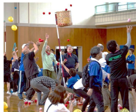
▲玉&高得点風船入れ合戦