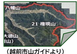
(越前市山ガイドより)

服間公民館では学級以外に、こども園・小学校、各町内の行事・取り組み等を取材し 広報紙に掲載していきます。さあ！皆様と一緒に「服間ものがたり」紡いでいきましょう！