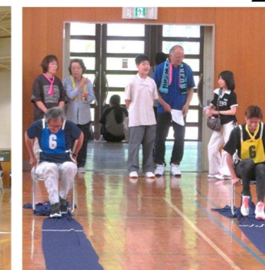
▲お座り布引きレース