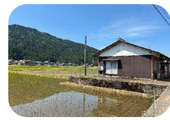
→東椋尾集落センター