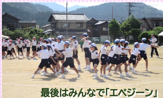
最後はみんなで「エペジーン」

「南中山健康たいそう」は、小学校では少しアレンジが加わり「わかくさハッピー赤米ダンス」の名称で親しまれています。この「わかくさハッピー赤米ダンス」のお披露目が 5 月 18 日(日)小学校の体育大会で行われました。夏日のような晴れ渡る晴天のもと、児童たちの元気なダンスで体育大会の幕開けを飾りました。