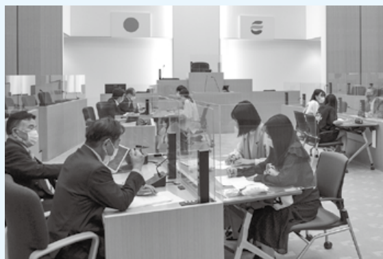
議場で仁愛大学生と議論

議員からは、「得られたアイデアや生の声を今後の議会、議員活動に生かしていきたい」などの意見がありました。