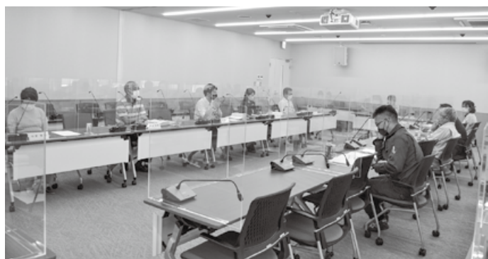
第2回議会モニター会議 (7月12日開催)

地域福祉に対する 深い地域の理解が重要 地域包括支援センターとの語る会 (教育厚生委員会)