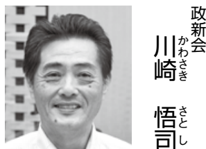
政新会 川崎 悟司

組織については、直面する行政課題や新たな市民ニーズへの対応など、時々の状況や必要に応じて改廃していくものであり、人事についてもその職の必要性や年齢構成等も踏まえ柔軟に配置し機能的な体制の構築に努めている。2人体制とした副市長については、龍田副市長は新駅周辺の開発及び企業誘致に関すること、小泉副市長は豊富な行政経験を生かし、全体を担当していく。