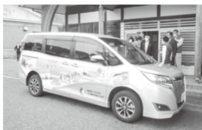
永平寺町「近助タクシー」

これらの調査研究を踏まえ、委員からは、令和6年の北陸新幹線「越前たけふ駅」の開業に向け、二次交通や並行在来線の在り方についても議論していかねばならないとの意見がなされ、今後地域公共交通について、議会全体で共有し、研究を深めていくべきであるとの認識で一致した。