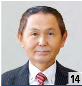
だいぶつ しんいち 題佛 臣一