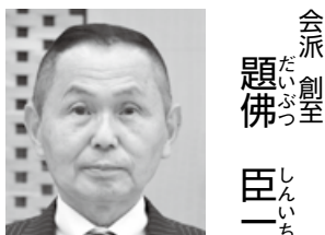
会派 創全 題佛 臣一