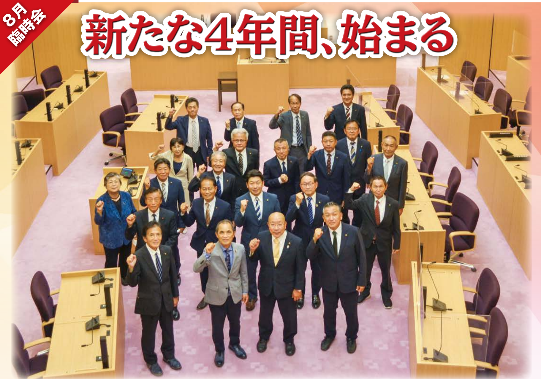
越前市議会議員(議場にて撮影)