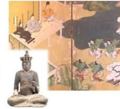
源氏物語背景にある仏教思想を国府時代の仏像で紹介 10/25-11/24 「国府時代の仏像」展