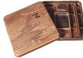
初音（はつね）硯箱 蒔絵作品 7/26-9/1 「源氏物語が彩る工芸」展

国府発掘調査の「速報展示」等を開催し、市民や観光客がまちなかで気軽に芸術文化に触れられるようにする。