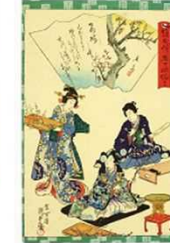
源氏物語紅梅巻テーマの錦絵 1/31-3/9 「紫式部・源氏物語関連 錦絵（浮世絵）」展