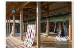
NHKホームページより引用