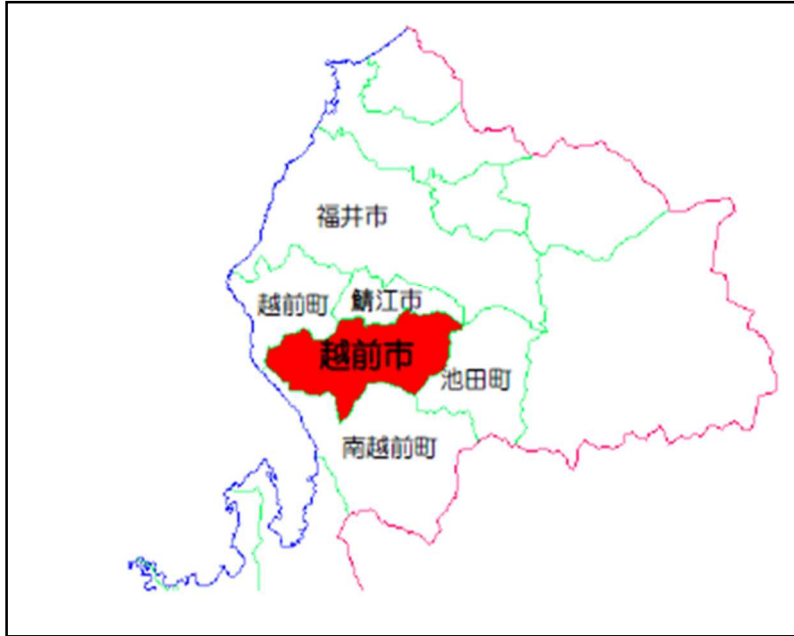
図1 越前市の位置図